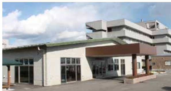
しおや総合在宅ケアセンター

【休日】4週8休制(シフト制)、夏季休暇・冬季休暇あり、有給休暇制度(初年度12日、2年目16日、3年目以降20日付与) 慶弔休暇、産前産後休暇、介護休暇、看護休暇、育児休暇、リフレッシュ休暇制度あり