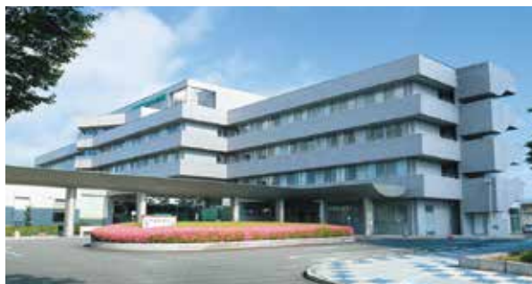
国際医療福祉大学塩谷病院

施設見学も承っております。お気軽にお申し付けください。(※コロナ対策のため事前予約制)