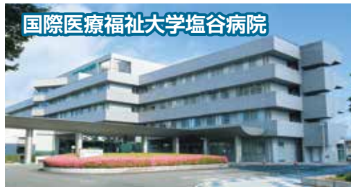
国際医療福祉大学塩谷病院

新卒も募集しています。(②、③、④、⑤、⑥、⑦) パート希望の方は勤務日数・勤務時間をご相談下さい。 施設見学をご希望の方は、お気軽にお問い合わせください。