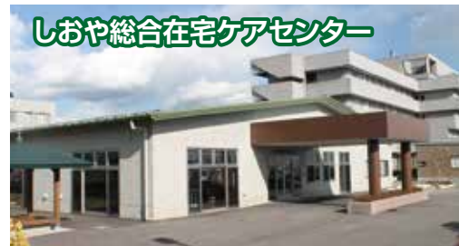
しおや総合在宅ケアセンター