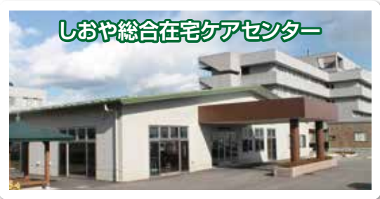
しおや総合在宅ケアセンター