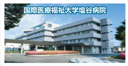
国際医療福祉大学塩谷病院

新卒も募集しています。(①・②・③) パート希望の方は勤務日数・勤務時間をご相談下さい。 施設見学をご希望の方は、お気軽にお問い合わせください。