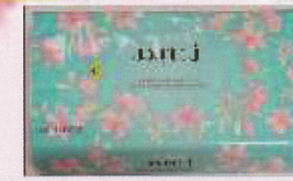
ソフトティッシュ