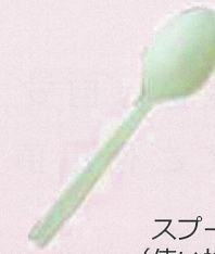
スプーン (使い捨て)